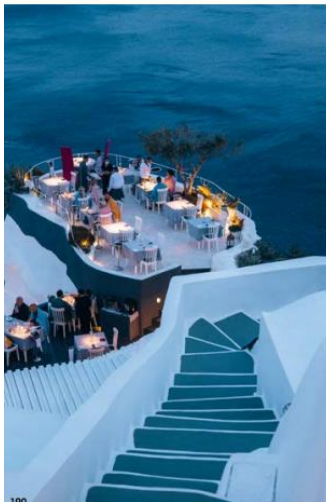
A ESQUERDA - Andronis Luxury Suites. ACIMA - Restaurante Lycabettus do Andronis Luxury Suites. NOMEIA AO LADO DA ESCADARIA PARA CIMA - Atoni Sunset Lounge do Kalesma; visto para o mar do quarto do Kalesma