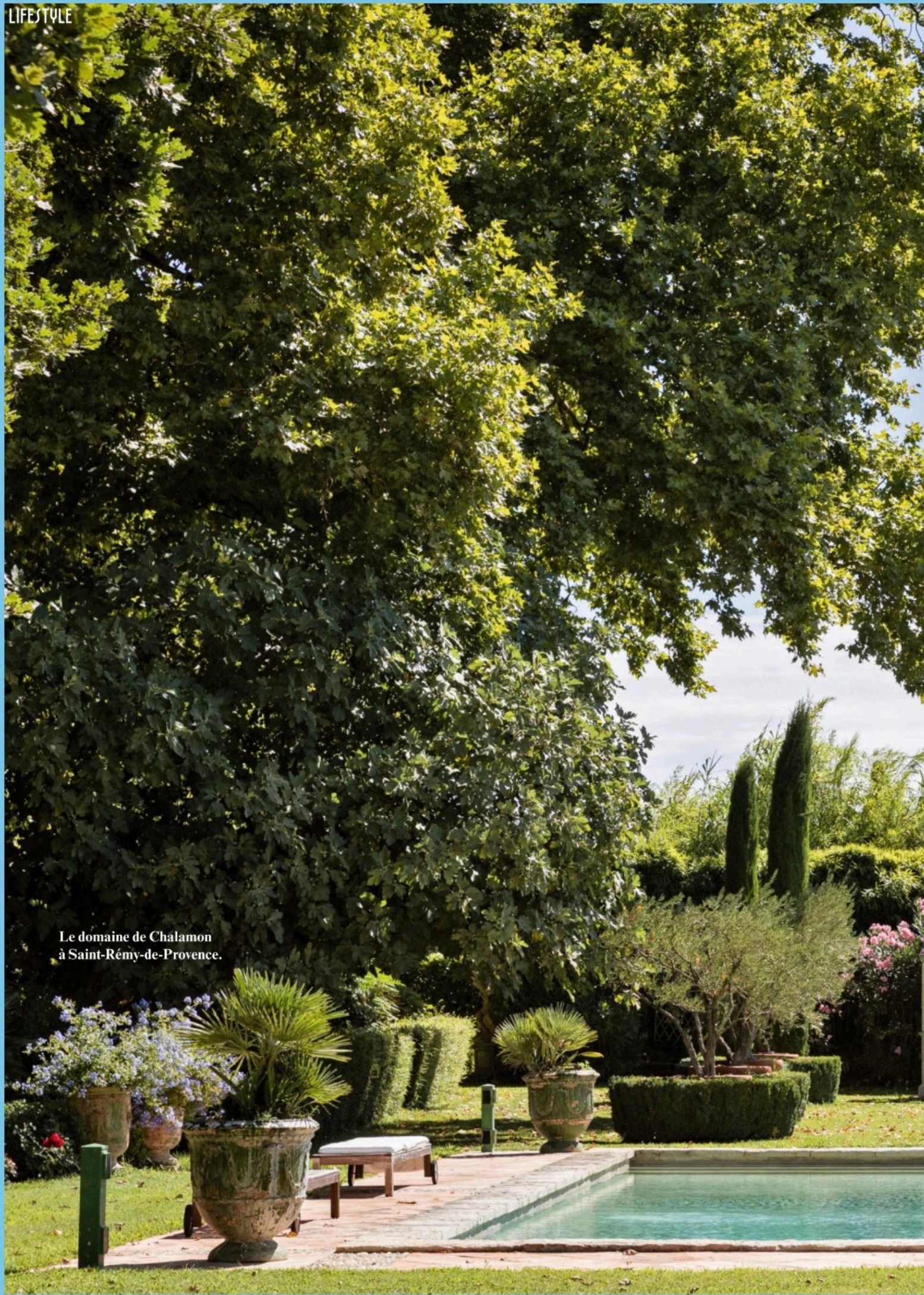
Le domaine de Chalamon à Saint-Rémy-de-Provence.